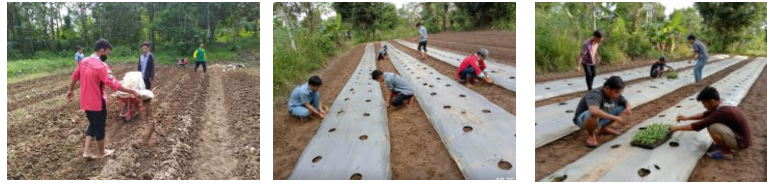
Gambar 6. Penanaman Bibit Cabai di lahan Demplot