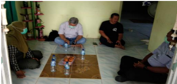
Gambar 1. Diskusi Dirumah Ketua Kelompok Tani Sederhana

Kegiatan dimulai dengan komunikasi via telepon dan kunjungan langsung ke petani di kelurahan Sari Jaya khusus kelompok tani Sederhana dan Setaria (Gambar 1). Beberapa tahun lalu produksi tanaman hortikultura (khususnya cabai, tomat dan terong) belum begitu memuaskan, karena petani belum mengetahui tingkat kesuburan dan keasaman tanah. Setelah dilakukan penyuluhan dan pendampingan khususnya menganalisis sifat kimia tanah dan cara mengolah pupuk organik dari kandang sapi yang dimiliki, petani sudah mampu meningkatkan produksi cabai dan petani mampu memproduksi pupuk organik dan meningkatkan nilai ekonominya. Secara otomatis pendapatan petani di dua kelompok ini juga meningkat, karena produksinya berkualitas sehingga permintaan juga meningkat.