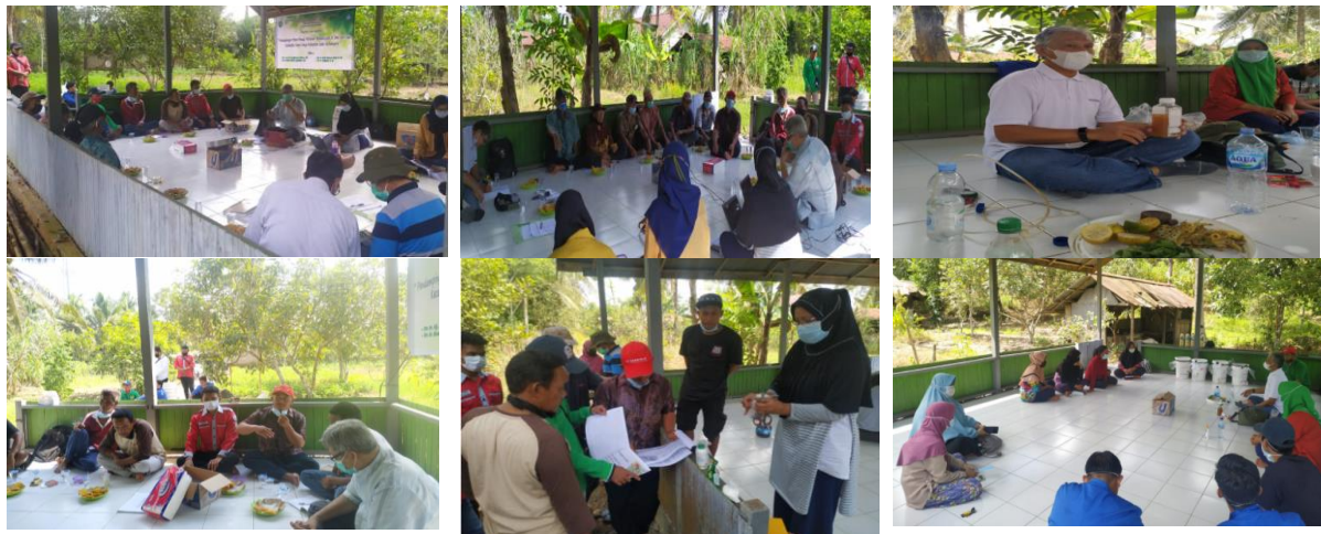
Gambar 3. Penyampaian Materi Penyuluhan Oleh Nara Sumber Dan Dilanjutkan Diskusi Dengan Peserta Penyuluhan

yang disampaikan yaitu; Bahan Organik Sekitar dengan Kandungan Nitrogen (N) tinggi , Membuat Pupuk Organik Cair (POC) dan Pestisida Organik dan Membuat Eko Enzim. Penyampaian materi dilakukan dengan metode ceramah dan menampilkan materi ceramah dengan power point. Setelah ceramah dilakukan diskusi dengan petani, baik itu tanya jawab maupun berbagi pengalaman antar petani dan narasumber. Kegiatan ceramah dan diskusi dapat dilihat pada Gambar 3.