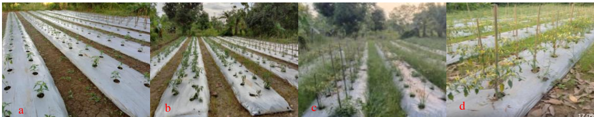
Gambar 7. Kondisi Tanaman Cabai Fase Vegetatif Sebelum Di Pupuk (a) dan Setelah Dipupuk POC (b). Fase Generative yang Hanya Dipupuk POC (c) dan Dipupuk POC + Pupuk Anorganik Setengah Dosis Anjuran (d)

Setelah 2 minggu setelah pembuatan POC maka, larutan POC di periksa apakah sesuai yang diharapkan. Keberhasilan pembuatan POC ditandai dengan larutan berwarna kuning hingga coklat, tergantung dari bahan yang digunakan. POC selanjutnya diaplikasikan ketanaman setiap minggu, POC yang banyak mengandung Nitrogen diaplikasikan pada fase vegetatif yaitu yang berasal dari daun Gamal. Pada Fase generatif bisa diaplikasikan semua POC yang dari bonggol pisang, sabut kelapa dan kulit pisang, karena banyak kandungan Phosphat dan Kaliumnya. Pada fase vegetatif terlihat pertumbuhan tanaman cabai bagus sekali setelah diaplikasikan POC. Memasuki fase generatif, sering hujan dengan intensitas cukup tinggi akibatnya tanaman sering tergenang air. Tanaman cabai yang pemupukannya dibantu setengah dosis yang lebih mampu bertahan dan berproduksi, namun produksinya pun masih sedikit dibandingkan apabila menggunakan pupuk anorganik dosis penuh. Lebih jelasnya ditampilkan pada gambar berikut.