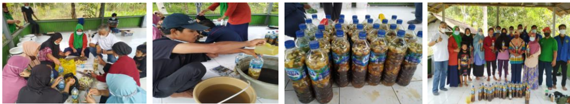
Gambar 5. Proses Pembuatan Eko Enzim.

menjadi 2 jenis yaitu eko enzim dari limbah buah-buahan dan sayuran. Prosesnya bahan organik dicacah kemudian dimasukkan ke wadah tertutup, ditambah gula dan air dengan perbandingan 1: 3 :10 (gula aren : bahan organik : air bersih). Campuran ini disimpan ditempat teduh dan dibiarkan hingga 3 bulan. Eko enzim berhasil dibuat dan dapat dipanen apabila cairan berbau asam segar, sesuai bahan yang digunakan. Gambar berikut memperlihatkan proses pembuatan eko enzim.