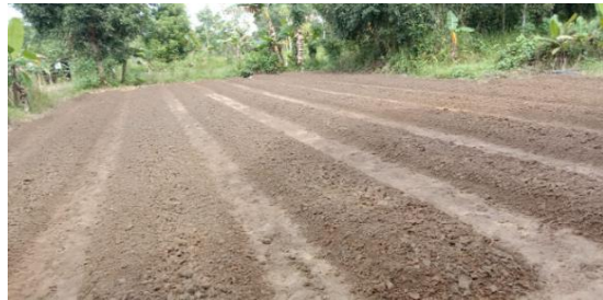
Gambar 2. Lahan Demplot untuk Tanaman Cabai

Dalam hal budidaya tanaman hortikultura petani masih tergantung pada penggunaan pupuk an organik dan pestisida sintetis. Hal ini dilakukan karena rendahnya kesuburan tanah dan petani masih kurang familiar serta merasa kurang praktis dalam membuat pestisida nabati. Keluhan petani adalah setelah beberapa kali musim tanam terjadi penurunan produksi. Selain itu perkembangan ilmu pengetahuan dan kesadaran masyarakat konsumen akan konsumsi hasil pertanian yang ramah lingkungan menyebabkan permintaan konsumen akan produk-produk pertanian yang ramah lingkungan atau produk pertanian organik. Petani menginginkan bimbingan dan pendampingan bagaimana melakukan budidaya pertanian yang ramah lingkungan, yaitu dengan meminimalkan penggunaan pupuk anorganik dan pestisida sintetis. Oleh karena itu penyuluhan saat ini adalah mengedukasi petani membuat pupuk organik cair (POC) dan eko enzim (EE) dengan bahan organik yang menghasilkan kandungan N, P dan K tinggi dan membuat demplot tanaman cabai (Gambar 2) untuk mengaplikasikan pertanian ramah lingkungan.