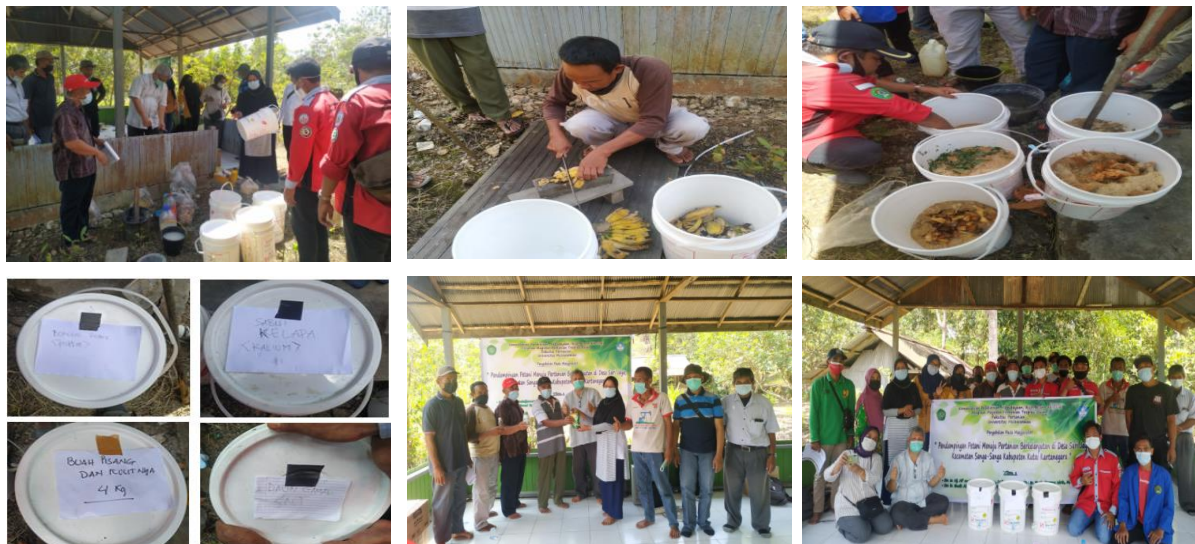
Gambar 4. Pengolahan POC, Penyerahan Bahan Pestisida Nabati dan Bibit serta Foto Bersama Peserta Penyuluhan

kelapa dan kulit pisang beserta buahnya yang kemasakan. Semua bahan organik dicacah sebesar 3-5 cm 2 . Pencacahan dimaksud agar membantu mempercepat penguraian bahan organik. Bahan-bahan tersebut masing-masing dimasukkan ke ember, ditambahkan air kelapa, air cucuian beras, larutan gula merah, dedak dan EM4 serta air sesuai dengan takarannya, diaduk hingga rata, terakhir ember ditutup rapat. Campuran tersebut diletakkan ditempat teduh, kemudian difermentasi selama 14 hari. Fermentasi dikatakan berhasil apabila cairan beraroma sesuai dengan bahan yang digunakan, berbau masam segar seperti tapai. Selanjutnya POC sudah dapat dipanen, dan ampasnya digunakan untuk pupuk organik padat. Peserta penyuluhan sangat antusias mengikuti penyuluhan ini hingga akhir kegiatan. Teknologi pengolahan POC sangat mudah dan relative murah, karena memanfaatkan bahan-bahan yang terbuang. Penyuluhan juga diikuti oleh mahasiswa KKN dari Universitas Mulawarman dan Politani Negeri samarinda. Kegiatan pengolahan POC dapat dilihat pada gambar berikut.