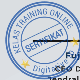
Fuji Lestari CEO Digitalive ID Jendral iTemplate ID