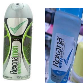
Gambar 1. Contoh Merek yang mempunyai persamaan pada pokoknya 4

dari Pemerintah. Dikarenakan masih banyak terjadi persaingan antar produsen pedagang untuk berlomba-lomba menawarkan berbagai jenis merek kepada konsumen, seperti contohnya ekuitas. Ekuitas merupakan salah satu tahapan sebuah merek atas produk menjadi merek yang dikenal oleh masyarakat. Terkenalnya suatu merek menjadi suatu "well known famous mark" , dapat memicu tindakan-tindakan pelanggaran merek baik berskala nasional maupun internasional. Sehingga perlunya ada tindakan tegas dari pemerintah melalui perpanjangan tangan melalui Direktorat Jenderal Kekayaan Intelektual Kemenkum HAM untuk menindak tegas para peniru merek dan memberantas upaya pendaftaran merek dengan persamaan dengan pokoknya. Merek dinilai mempunyai persamaan pada pokoknya apabila unsur pembentuk merek tidak identik dengan merek pihak lain namun ada tambahan atau modifikasi yang membuatnya tampak sedikit berbeda. Sehingga dapat membingungkan masyarakat dan berasumsi ada kaitan antara merek yang satu dengan yang lain dan menganggap keduanya bersumber dari produksi yang sama. Sebagai contoh produk dibawah ini