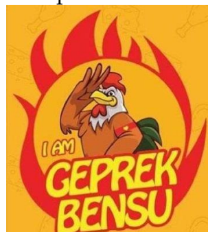
Gambar 4. Merek I'am Geprek Bensu Milik Benny Sujono 14