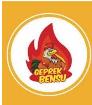
Gambar 3. Merek Geprek Bensu milik Ruben Onsu 13

dalam proses pendaftaran merek maka di khawatirkan akan timbul kasus-kasus serupa dikemudian hari.