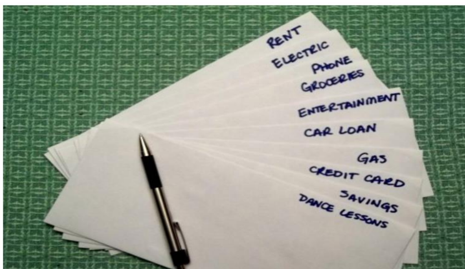
Gambar 2. Alokasi Dana Sistem Amplop