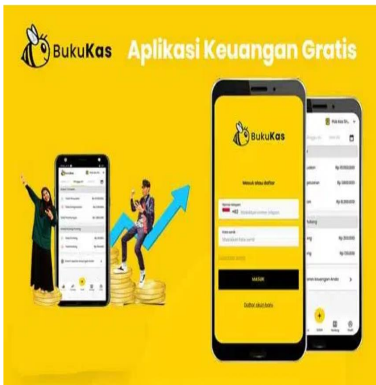
Gambar 5. Sistem Pembukuan Keuangan Harian

Tahap terakhir dalam manajemen keuangan keluarga adalah evaluasi. Menurut Masassya (2004 pp. 38-39), Evaluasi atau pemeriksaan keuangan dapat dilihat dari beberapa aspek, yaitu: