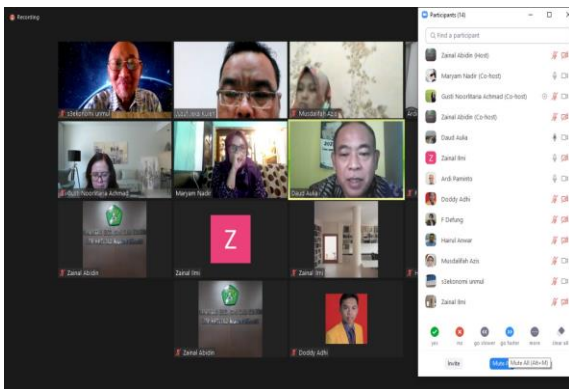
Gambar 5. Dokumentasi pertemuan

Setelah menentukan segmentasi pasar, posisi pasar, dan target pasar, kini adalah mendesain langkah strategis dalam bauran pasar yakni 4P ( price, product, promotion, dan place ). Menentukan harga yang sesuai dan kompetitif dengan segementasinya menjadi sangat krusial bagi setiap bisnis. Setidaknya, ada berberapa hal yang mempengaruhi posisi harga meliputi biaya produksi, permintaan dan penawaran pasar, harga kompetitor, kondisi ekonomi, faktor psikologis pelanggan, dan sensitivitas harga pelanggan. Sebuah produk memiliki 7 siklus hidup (tahap pengembangan, pengenalan, pertumbuhan, penjualan, kematangan, kejenuhan, dan penurunan). Lebih lanjut, promosi merupakan komunikasi yang berguna untuk menawarkan produk barang atau jasa agar konsumen mengenal atau membelinya. Tak kalah pentingnya, pendistribusian tentu dapat menentukan jauh atau dekatnya lokasi, sehingga mempengaruhi waktu dan harga. Ada dua bentuk saluran distribusi adalah untuk barang konsumsi dan barang industri [25].