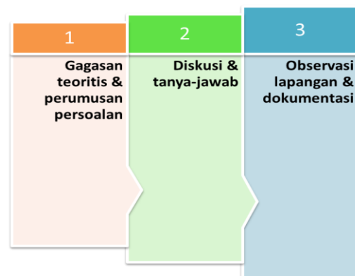
Gambar 2. Pola PAR dalam PkM

Sederhananya, tahapan PkM dilaksanakan sebanyak 2 kali (Mei – September 2021) dengan rincian rapat koordinasi, perumusan masalah, penelusuran/observasi lapangan [seperti 16], dan penyusunan dokumen ‘Profil dan Kesiapan BUMDes Sepakat’ sesuai arahan atau visi dari RPJM Desa Sepakat 2021-2026 yakni ‘Terwujudnya Kehidupan Masyarakat yang Berimbang dengan Tatanan Infrastruktur yang Terarah dan Pengembangan Sumber Daya Manusia yang Religius menuju Masyarakat Desa yang Maju, Adil, Aman, dan Harmonis’.