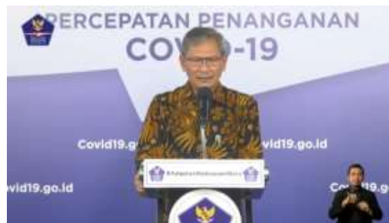
Sumber: Channel youtube BNPB

dengan keadaan yang bernilai baik, bergeser pada konteks pandemi menjadi hal yang buruk dan dihindari oleh masyarakat. Begitu pula dengan kata negatif yang berkonotasi buruk menjadi hal yang bermakna baik, dan diharapkan masyarakat. Kedua status di atas, menjadi kata yang familiar dan sering digunakan baik lisan maupun tulisan dalam interaksi sosial, menjadi wacana publik. Masyarakat memiliki konsep dan berusaha menghindari label positif kepada dirinya dikarenakan adanya sanksi sosial yang berlaku. Istilah baru yang muncul di tengah pandemi meliputi suspek , orang tanpa gejala (OTG) , orang dalam pemantauan (ODP) , pasien dalam pengawasan (PDP) , dan BNPB . Untuk pemahaman mengenai konteks dan pemaknaan telah disosialisasikan oleh pemerintah pusat maupun daerah melalui media elektronik dan sosial.