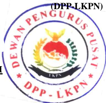
MARWAH YUNUS WAMBES. SE