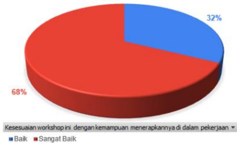
Gambar 4.1. Diagram Lingkaran Hasil Isian Kuisisioner

Terhadap pertanyaan apa saja yang paling disukai dengan adanya pendampingan, antara lain dijawab: Tips dan trik penyusunan pertanyaan dalam LKPD, tips dan trik menyampaikan materi sukar ke peserta didik agar mudah difahami, Penyampaian materi dan