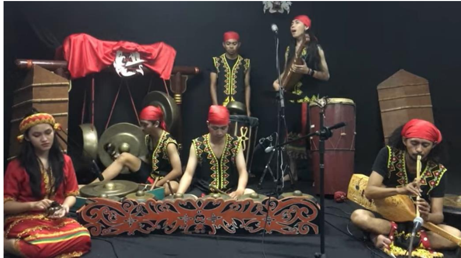
MERAJUT NADA NUSANTARA #2 episode 1