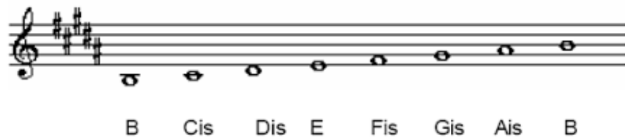
Notasi 3. Tangga Nada dalam Gendang Agong Paser (Transkripsi Penulis, 2021)

Dari kutipan diatas, penulis melihat tidak ada yang dapat dijadikan menjadi patokan dalam menentukan nada dasar pada kesenian Gendang Agong, sehingga penulis menggunakan aplikasi muscore untuk menentukan nada dasar pada Gendang Agong. Maka nada dasar yang digunakan dalam transkripsi Gendang Agong Paser ini adalah nada B Mayor.