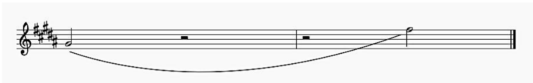
Notasi 3. Wilayah Nada dalam Gendang Agong Paser (Transkripsi Penulis, 2021)

Wilayah nada dalam sebuah komposisi musik merupakan jarak antara nada terendah ke nada tertinggi. Untuk menentukan jarak nada terendah ke nada tertinggi, penulis menggunakan garis paranada sehingga dapat dilihat dengan jelas susunan nada yang ada pada transkripsi andung tersebut. Hal ini dibuat untuk mempermudah penulis dalam melihat nada terendah dan nada tertinggi dalam andung.