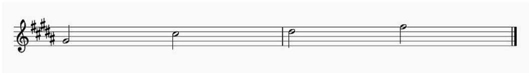
Notasi 2. Nada dalam Gendang Agong Paser (Transkripsi Penulis, 2021)

Nettel (1964:145) mengemukakan cara mendeskripsikan tangga nada dengan menuliskan nada yang dipakai dalam lagu. Tangga nada dalam notasi barat merupakan kumpulan nada yang disusun sedemikian rupa berdasarkan aturan yang ada sehingga membentuk suatu karakter tertentu. Dalam mentranskripsikan Gendang Agong, penulis menuliskan urutan-urutan nada mulai dari nada yang terendah hingga nada yang tertinggi.