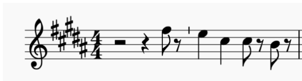
Notasi 4. Nada yang sering digunakan dalam Gendang Agong Paser (Transkripsi Penulis, 2021)

Dengan demikian nada yang paling sering digunakan adalah nada Fis kemudian nada E, selanjutnya nada Cis, dan dan terakhir adalah nada B. Berikut merupakan gambar nada yang sering digunakan hingga yang jarang digunakan dengan menggunakan harga not sesuai dengan urutannya.