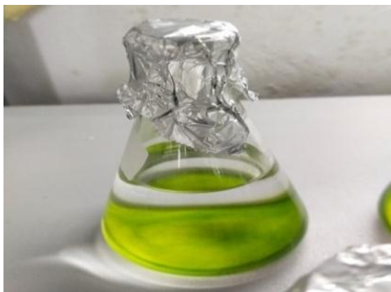
Gambar 1. Mikroalga Botryococcus braunii

lainnya dari bahan energi termasuk biomassa. Parameter kinetik yang ditentukan dari analisis termogravimetri dapat berguna untuk merancang reaktor pirolisis, optimasi operasi dan produksi biofuel . Data kinetik yang diperoleh juga umumnya digunakan untuk memvalidasi mekanisme dekomposisi termal dari pirolisis biomassa [4]. Beberapa penelitian yang menggunakan TGA telah dilakukan untuk mempelajari karakteristik pembakaran mikroalga atau biomassa [5].