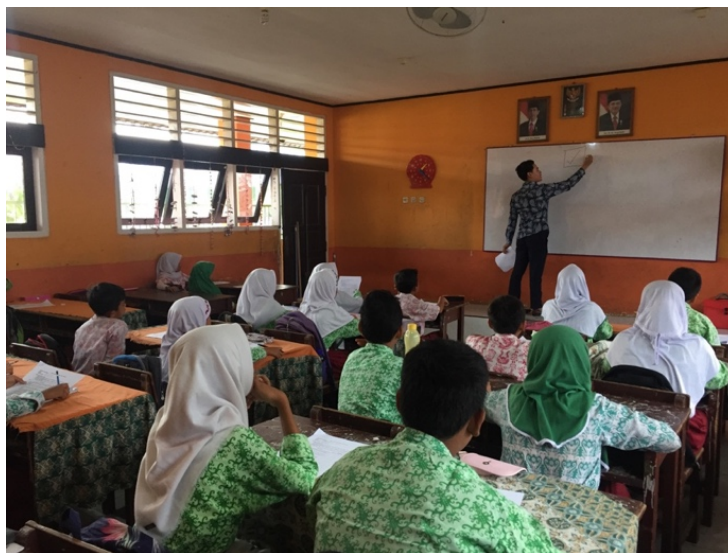
Gambar 1. Siswa SDN 007 Samarinda