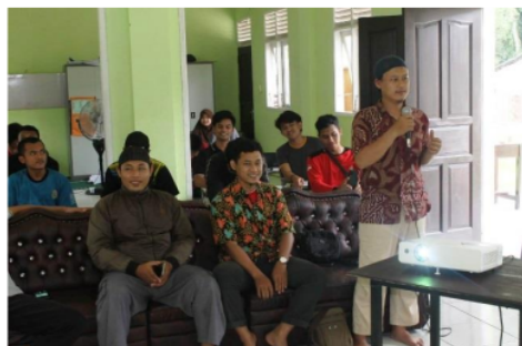
Gambar 3. Pelaksanaan Kegiatan peningkatan literasi pemahaman pengelolaan aset wakaf produktif di Pondok pesantren

pengelolaannya yang syar'i sekaligus produktif. Keaktifan peserta mengikuti kegiatan ini juga terdorong oleh kebutuhan mereka untuk mendalami hal-hal yang berkaitan dengan wakaf produktif, karena kegiatan penyuluhan tentang wakaf baru pertama kali ini dilaksanakan di Pondok mereka.