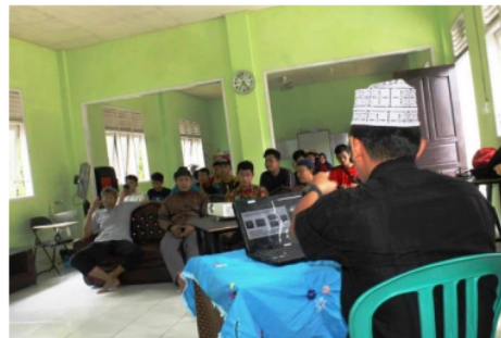
Gambar 2. Pelaksanaan Penyuluhan Pengelolaan asset wakaf secara produktif

Pelaksanaan kegiatan dilakukan di Gedung pertemuan Pondok pesantren Shuffah Hizbullah, sesuai dengan kesepakatan dengan mitra, penyuluhan berisikan materi tentang (1) Seluk beluk hukum wakaf dalam tinjauan hukum agama dan hukum positif, (2) Peningkatan pemahaman tentang kriteria dan bagaimana menjadi Nazhir yang professional, (3) Penyuluhan tentang Manajemen dan model pengelolaan wakaf yang produktif, (4) Pendampingan penyusunan rencana pengelolaan asset wakaf Pesantren.