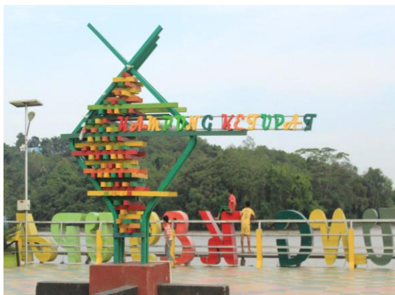
Gambar 1. Objek kegiatan

Motivasi acara ini merupakan bagian dari kegiatan yang rutin dilakukan oleh para peneliti dari Fakultas Ekonomi dan Bisnis Universitas Mulawarman Samarinda. Pendekatan kegiatan dilakukan secara luring (luar jaringan) untuk dapat langsung bertemu dengan para pelaku pengraji ketupat. Dari sisi lain, disetiap akhir pelatihan dan pendampingan dilakukan tanya jawab [11]. Pendekatan secara luring tentu saja dengan memperhatikan protokol kesehatan sesuai anjuran pemerintah. Dalam hal ini membantu mengurangi permasalahan yang terjadi dalam melakukan hubungan pemasaran, menghindari terjadinya penurunan pendapatan pada pelaku UMKM pengrajin ketupat serta membangun kerjasama UMKM dan PKK dengan beberapa kegiatan yang dilakukan diantaranya: (1) Memberikan pelatihan dan pendampingan pembuatan blog untuk pemasaran secara online; (2) Mempromosikan fotografi produk yang dihasilkan; (3) Pengarahan dalam pemotretan hasil produk; (4) Pelatihan mengelola pembukuan keuangan secara sederhana; dan (5) Mendorong pembuatan cinderamata berbahan baku dari limbah daun nipah.