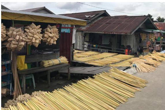
Gambar 2. Produk UMKM yang dihasilkan

Tim pengabdian juga akan membantu dalam melakukan promosi produk di jejaring sosial tersebut. Program tersebut dilakukan dengan tujuan akhir adalah untuk meningkatkan dan memperluas jaringan pemasaran produk agar banyak diketahui oleh masyarakat dengan promosi produk melalui baik melalui jejaring sosial dengan media online .