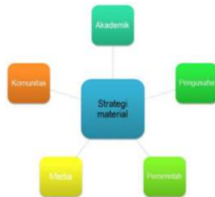
Gambar 2. Keterlibatan komponen 'A-B-G-M-C'

Strategi lain yang perlu ditonjolkan adalah strategi fungsional. Erdem & Erdem (2011) menjelaskan bahwa mereka mengklasifikasikan strategi sebagai pendukung dan fase menuju keberhasilan strategi lainnya. Dalam penerapannya, meskipun isu-isu strategis, fungsi manajerial, dan fungsi ekonomi menjembatani pola strategi fungsional, dengan asumsi bahwa situasi tertentu diketahui atau telah diproyeksikan, ada prediksi yang tidak memungkinkan perubahan drastis, dan kontrol lingkungan yang teratur (Altuntaş, 2014). Tak terbendung tentang bagaimana strategi perusahaan memposisikan proses yang relevan dan mekanisme yang disarankan untuk memasukkan pemangku kepentingan, standar masyarakat, norma, nilai, dan harapan (Steyn & Niemann, 2010).