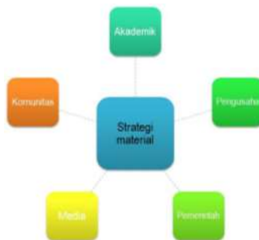
Gambar 2. Keterlibatan komponen 'A-B-G-M-C'

Strategi lain yang perlu ditonjolkan adalah strategi fungsional. Erdem & Erdem (2011) menjelaskan bahwa mereka mengklasifikasikan strategi sebagai acuan dan fase menuju keberhasilan strategi lainnya. Dalam penerapannya, meskipun isu-isu strategis, fungsi manajerial, dan fungsi ekonomi menjembatani pola strategi fungsional, dengan asumsi bahwa situasi tertentu diketahui atau telah diproyeksikan, ada prediksi yang tidak memungkinkan perubahan drastis, dan kontrol lingkungan yang teratur (Altuntaş, 2014). Tak terbendung tentang bagaimana strategi perusahaan memosisikan proses yang relevan dan mekanisme yang disarankan untuk memasukkan pemangku kepentingan, standar masyarakat, norma, nilai, dan harapan (Steyn & Niemann, 2010).