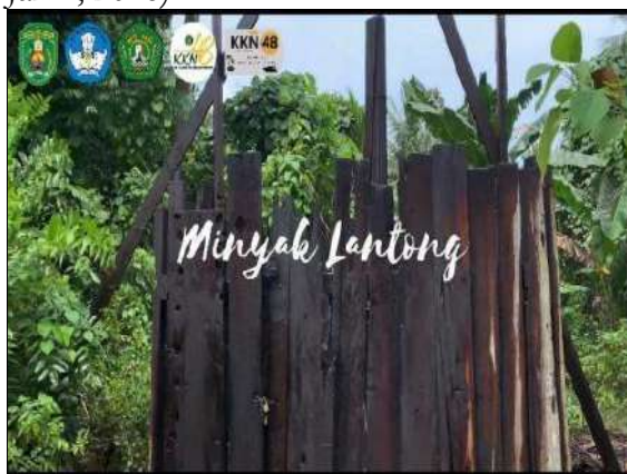
Gambar 7. Minyak Lantong

Berbagai potensi Pulau Miang ini, kurang dipromosikan. Oleh karena itu, output yang dihasilkan pada pengabdian ini, yaitu: artikel, video, dan berbagai dokumen lainnya agar dapat dijadikan media promosi. Namun diharapkan promosi pariwisata berkelanjutan dapat diperhatikan (Cristobal-Fransi et al. , 2020). Di antara output yang dihasilkan adalah video tentang Desa Wisata Bahari Pulau Miang yang telah diunggah di kanal YouTube. Hal ini diharapkan akan memperkaya literasi digital yang saat ini berkembang pesat (Veronika et al. , 2022). Untuk membantu pengembangan ekowisata Pulau Miang, maka dapat diberdayakan kelompok sadar wisata atau pokdarwis dan juga kelompok Karang Taruna Desa Pulau Miang. Selain itu, ekowisata juga dapat dikemas menjadi suatu pariwisata berkelanjutan (Waluya & Jamil, 2016).