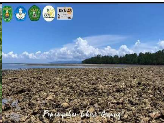
Gambar 8. Gusung