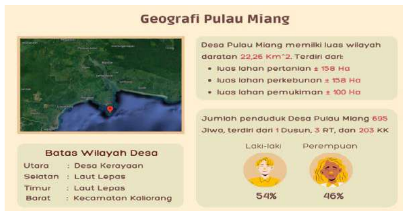
Gambar 2. Geografi Desa Pulau Miang

Infografis adalah sebuah konsep yang menyajikan informasi dengan desain dan kreativitas yang tinggi agar tampilannya menarik dan mudah dibaca. Daya tarik, penempatan elemen, dan waktu yang diperlukan dalam menyimpulkan informasi ke dalam bentuk infografis (Miftah, et al. , 2016). Infografis yang penulis lakukan dibuat menggunakan aplikasi Canva. Langkah pertama dalam pembuatan infografis, yaitu: mencari template sebagai dasar acuan desain. Langkah selanjutnya isi dan elemen dari infografis disesuaikan dengan informasi dari desa.