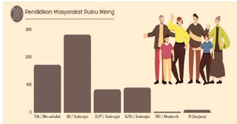
Gambar 4. Pendidikan Masyarakat Desa Pulau Miang