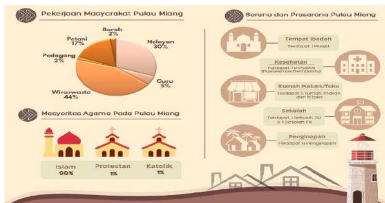
Gambar 5. Pekerjaan, Agama, dan Sarana Prasarana di Desa Pulau Miang