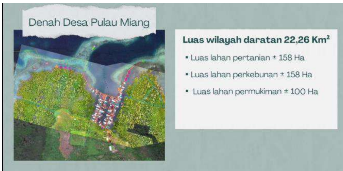
Gambar 1. Denah Pulau Miang Sumber: KPS (Kajian Pemetaan Sosial), 2022