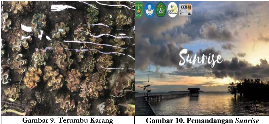
Gambar 9. Terumbu Karang