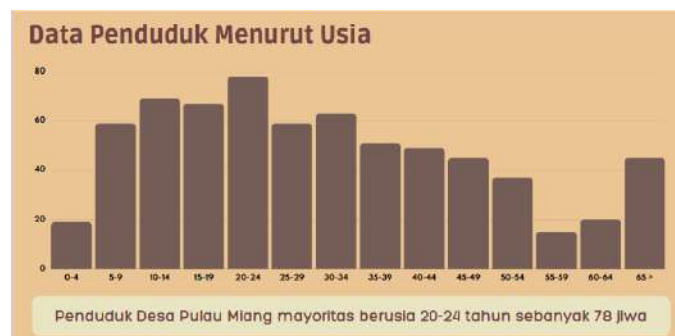
Gambar 3. Data Penduduk Desa Pulau Miang