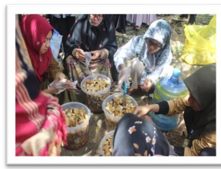
Gambar 1 dan 2. Penyampaian Materi dan Pelatihan Pembuatan Eco-enzym