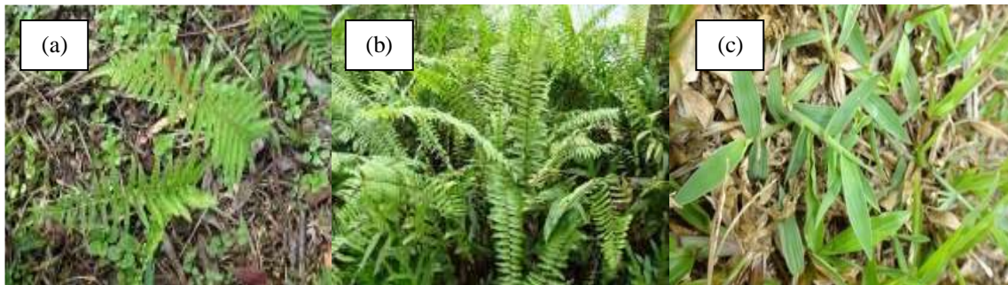
Gambar 2. Tiga jenis tumbuhan herba yang diteliti (a) Cyclosorus interruptus , (b) Nephrolepis biserrata , dan (c) Digitaria didactyla .

Plot penelitian jenis Cyclosorus interruptus terletak pada titik koordinat X: 523159 koordinat Y: 9950704, jenis Nephrolepis biserrata terletak pada koordinat X: 523255 koordinat Y: 9950707, dan jenis Digitaria didactyla terletak pada koordinat X: 523225 koordinat Y: 9950759.