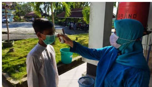
Gambar 1. Pengukuran suhu peserta sirkumsisi