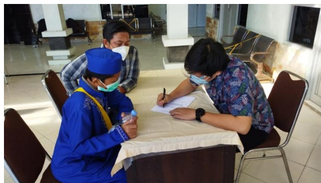
Gambar 2. Anamnesis riwayat kesehatan dan pendaftaran oleh Dokter Muda