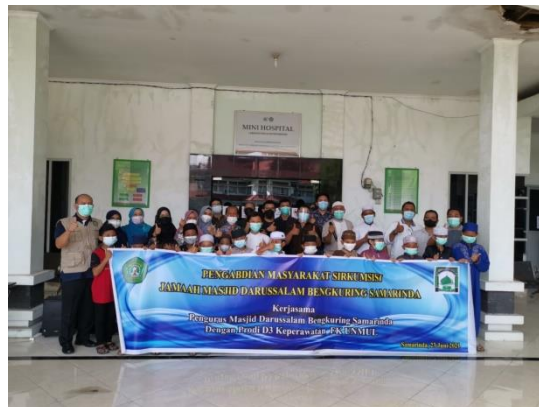
Gambar 5. Foto bersama peserta sirkumsisi