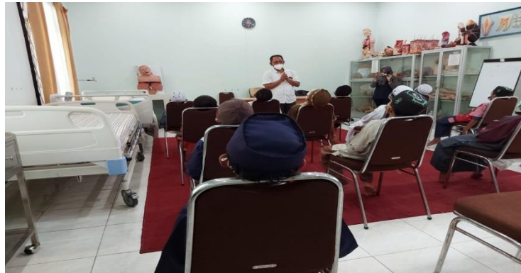
Gambar 3 Manajemen nyeri dengan hipnoterapi sebelum sirkumsisi