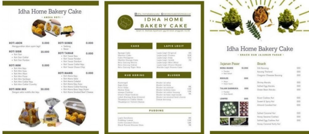
Gambar 4. Tampilan Menu

Pembuatan menu bertujuan untuk memudahkan konsumen dalam melihat harga dan memilih menu yang akan diinginkan, sehingga kami memilih meletakkan menu pada bagian sorotan cerita dimedia instagram sehingga konsumen tidak perlu melihat jauh kebawah pada postingan foto yang ada untuk mencari menu produk dari umkm tersebut.