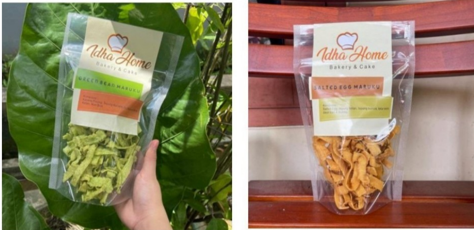
Gambar 6. Stiker dan Kemasan

Mittleman (dalam Ardy, 2007:11) menyampaikan bahwa kemasan adalah alat pemasaran yang krusial, karena kemasan adalah penjual tanpa suara (silent salesman). Stiker adalah suatu media informasi visual yang berbentuk kertas kecil yang dapat ditempelkan. Kemasan adalah desain kreatif yang berisikan bentuk material warna dan juga struktur dengan berisikan informasi produk agar produk dapat dipasarkan. Untuk memberikan tampilan kemasan yang cantik dan sebagai identitas suatu produk untuk menarik minat konsumen. Desain stiker dan kemasan sangat penting untuk setiap tampilan dari produk, ini juga menjadi salah satu sarana untuk mengkomunikasikan isi produk secara visual kepada konsumen.