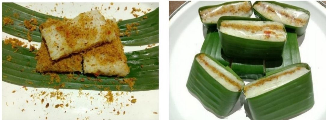
Gambar 5. Foto Lempeng Dengan Isian Abon Ikan

Pengolahan ikan menjadi sebuah produk seperti abon ikan yaitu untuk memberikan variasi topping atau isian yang berbeda untuk produk lempeng yang ada dijual di tempat umkm. Varian rasa abon ikan ini dibuat untuk memberi tambahan rasa selain isian abon ayam yang sudah ada. Abon ikan ini bisa dibuat dari ikan kecil atau ikan yang kurang laku dipasaran sehingga dapat menghemat pengeluaran. Selain menjadi tambahan varian isi yang berbeda, abon ikan ini bisa menjadi lauk untuk dirumah, dan bisa juga untuk menjadi produk yang dapat dijual sehingga memiliki nilai jual yang lebih.