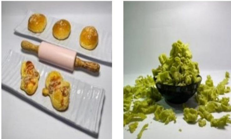
Gambar 1. Foto Produk

Foto produk adalah bagian dari advertising, karena dalam sebuah frame harus bisa menciptakan image sebuah produk. Kunci dari foto produk adalah bagaimana seorang fotografer bisa membuat citra yang terdapat dalam produk tersebut leat angel dan juga konsep. Hal yang paling penting dalam foto produk adalah bagaimana foto tersebut dapat meningkatkan penjualan barang dalam suatu bidang usaha. Foto produk dapat membuat barang agar terlihat sangat bagus dan konsep yang menarik sehingga pembeli dapat tertarik dan merasa penasaran dengan barang tersebut. Kegiatan ini dilakukan mulai minggu kedua dalam masa pelaksanaan kkn. Kegiatan ini diawali dengan menyiapkan perlengkapan yang dibutuhkan dalam pelaksanaan foto produk, antara lain: lightning, meja, kertas karton putih (sebagai background), kamera dan menyiapkan produk yang ingin difoto.