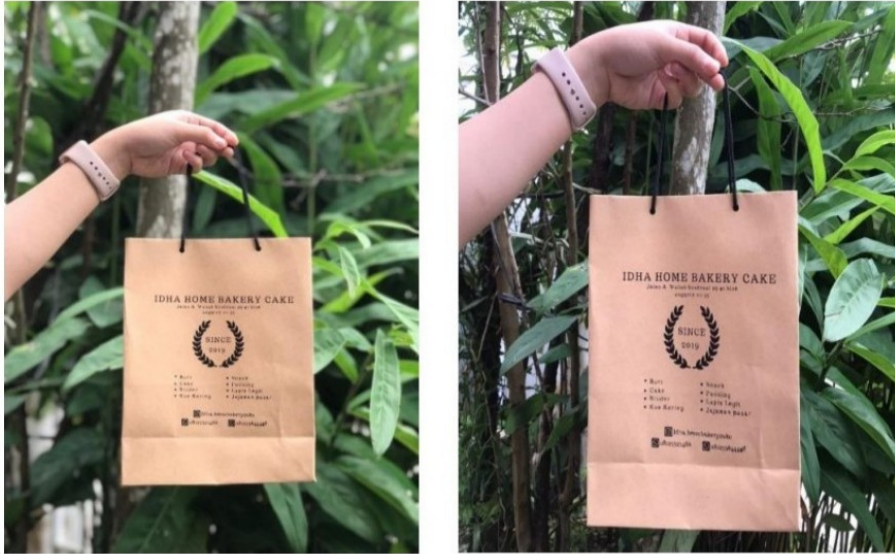
Gambar 7. Paper Bag