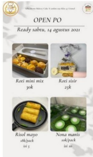
Gambar 2 Iklan Produk