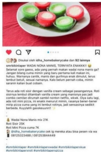
Gambar 3. Endorse Produk dengan menggunakan jasa akun @smbikinlaper