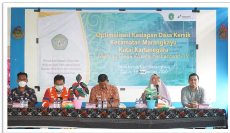
Foto suasana kegiatan seminar

Desa Kersik didiami mayoritas suku Bugis. Potensi pesisir pantai yang terdapat di desa ini sangat menarik untuk dikunjungi. Seperti pantai biru yang sangat eksotis dalam melihat matahari terbit yang berbalut pasir yang putih. Selain itu memiliki potensi ikan dan pengolahan garam. Saat ini dipimpin oleh Kepala Desa yang masih tergolong muda dan agresif mewujudkan desa Kersik yang ramai dikunjungi wisatawan. Namun yang menjadi kendala utama di lokasi adalah kesadaran masyarakat tentang penting pengelolaan wisata yang bisa mendongkrak ekonomi penduduk. Jadi objek wisata tak terkelola dengan baik. Potensi lain dari Kersik seperti Hutan Mangrove dan Tambak Garam.