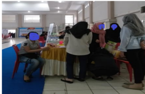
Gambar 4. Pengemasan masker

Metode yang ketiga kami menerima barang pesanan yang akan dibagikan ke masyarakat Kelurahan Mesjid. Barang yang kami terima dalam keadaan baik. Selanjutnya kami langsung mengemas masker dan faceshield ke dalam plastik. Pengemasan masker dan faceshield berlangsung seperti pada Gambar 4 berikut.