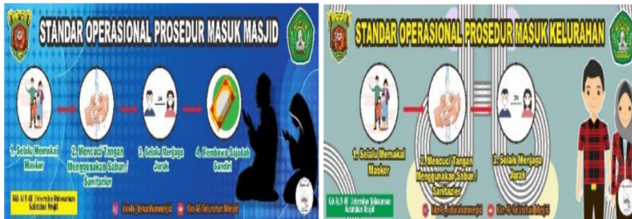
Gambar 5. Penempatan Spanduk SOP dan Protokol Kesehatan serta perizinan

kegiatan ini melalui pertemuan dengan Kelurahan Mesjid untuk mendesain spanduk. Dalam langkah ini kami berhasil mendesain 3 spanduk yang akan dipasang di Kelurahan Mesjid. Adapun desain spanduk yang dibuat seperti pada Gambar 5 berikut.