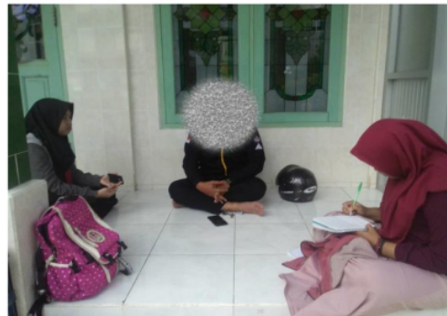
Gambar 2. Penggalan data awal

Metode yang pertama kali kami lakukan adalah mencari informasi melalui pihak kelurahan mengenai masyarakat yang ada di kelurahan mesjid. Pencarian informasi ini bertujuan untuk mengetahui tentang hal apa saja yang bisa kami lakukan untuk mengatasi keadaan dan kesulitan yang terjadi di kelurahan Mesjid. Informasi yang disampaikan pendamping lapangan mengenai masyarakat yang ada di kelurahan mesjid adalah masih banyak masyarakat yang acuh seperti lalai dalam memakai masker, jarang mencuci tangan pada saat keluar dari rumah, warga masih sering berkerumun, dan tidak menjaga jarak satu sama lain. Proses penggalan data awal ini berlangsung seperti pada Gambar 2 berikut.