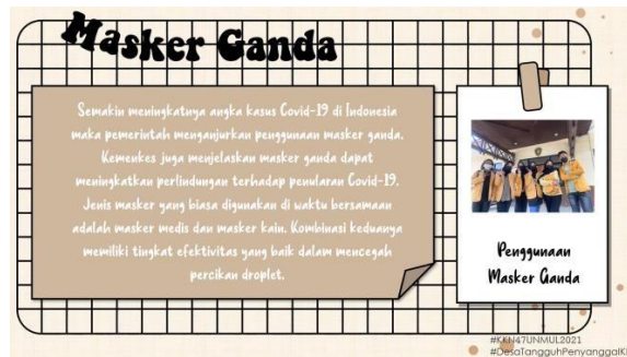
Gambar 2 Edukasi menggunakan masker ganda

oleh pemerintah dengan penggunaan masker dua lapis yaitu masker medis pada lapis pertama serta masker kain pada lapis kedua dapat mengurangi tingkat terjadinya penyebaran virus Covid-19 kami menyebarkan di media sosial masing-masing anggota kelompok agar informasi yang berisi penggunaan masker ganda ini cepat menyebar kepada masyarakat.