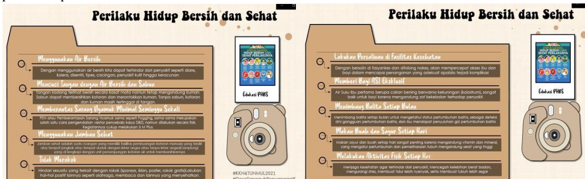
Gambar 3 Kegiatan edukasi perilaku hidup bersih dan sehat

Untuk kegiatan penempelan stiker serta edukasi Pengenalan Hidup bersih dan Sehat (PHBS) telah kami laksanakan di beberapa titik yang sering dikunjungi masyarakat, salah satunya pedagang yang berjualan di pinggir pelabuhan penyeberangan karena tempat ini merupakan tempat keluar masuknya masyarakat dari luar daerah atau sebaliknya dengan mengenalkan gaya hidup sehat pada masyarakat dapat menciptakan pentingnya hidup sehat pada masa pandemi ini.