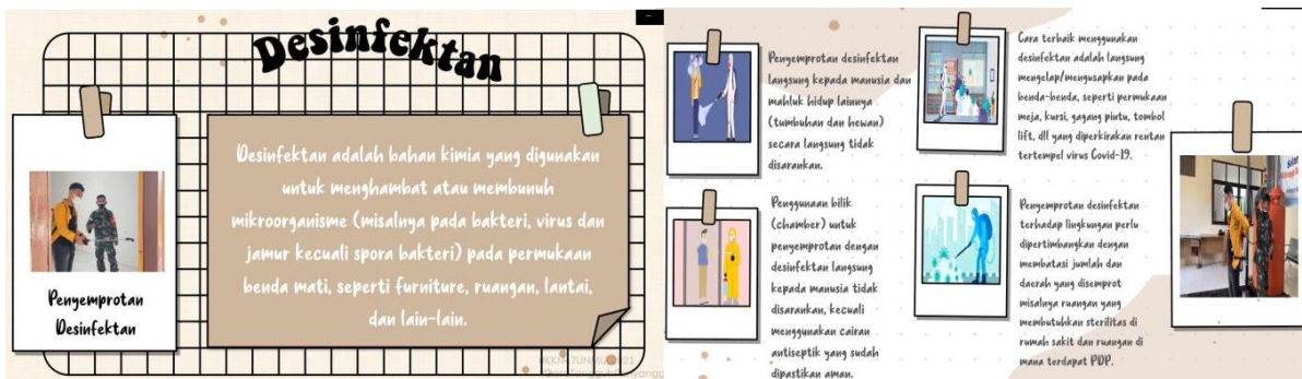
Gambar 2. Kegiatan desinfektan

Selanjutnya penyemprotan disinfektan juga telah selesai dilaksanakan, dimana lokasi yang dipilih sebagai tempat penyemprotan adalah tempat yang sering dikunjungi atau prasarana umum di Kelurahan Penajam, lokasi yang dipilih sering mengadakan kegiatan sosial yang mengundang beberapa warga sehingga dengan adanya kegiatan ini sangat disambut baik oleh warga sekitar, adanya penyemprotan disinfektan dapat mengurangi dampak penyebaran Covid-19.