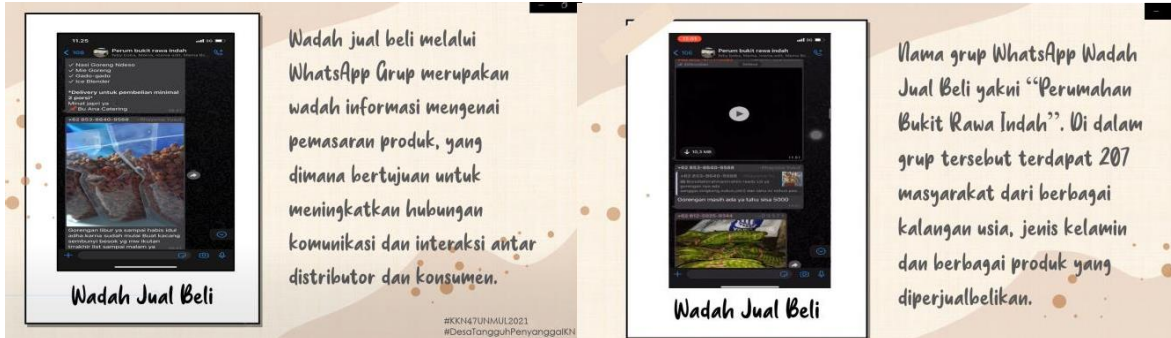
Gambar 1 Wadah jual beli kampung warrior

terkait kampung warrior demi menciptakan desa tangguh ekonomi dan kesehatan. Pelaksanaan program kerja online di RT 27 dalam kegiatan jual beli melalui grup whatsapp ternilai sangat aktif bahkan hingga sampai saat ini masyarakat RT 27 terus memasarkan produk yang mereka jual dengan ini dapat membantu ekonomi masyarakat pada masa pandemi ini.