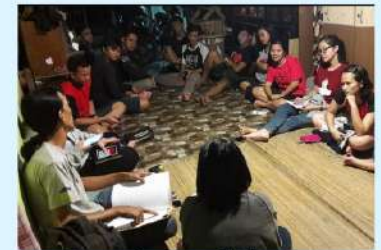
Pendampingan dalam menghimpun suara tokoh adat, maestro seni guna mendapatkan model konservasi musik tradisi sesuai keinginan masyarakat Bahau