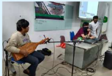
Pelatihan perekaman Audio Video