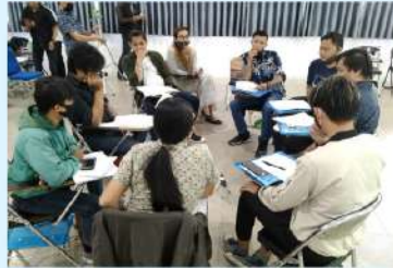
Pelatihan Strategi Konservasi Musik Tradisi