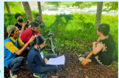
Pendampingan perekaman Audio Video